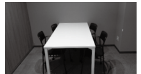
① 4人用ミーティングスペース × 4