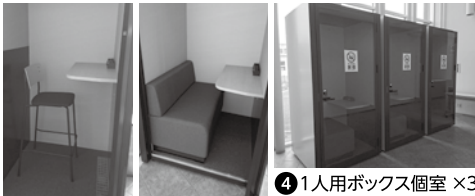
④ 1人用ボックス個室 × 3

市民や企業の方々の仕事をサポートするために、Wi-Fi環境完備の無料テレワークスペースを開設しました! 家や会社とは違う空間で、新しい働き方の形としてテレワークスペースを活用してみませんか?