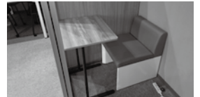
② 1人用テーブルと椅子 × 1