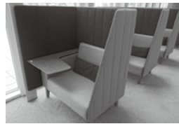
③ 1人用テーブル付ソファー × 3