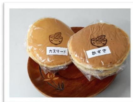
お茶屋さんのどらやき

看板メニューの『焼きもち』は発売当初、抹茶あん・小豆あんの2種類のみでしたが、今ではなんと10種類以上！他にもふわふわ食感がたまらない冷たい生大福、たいやき、ドリンクも豊富に取り揃えています。