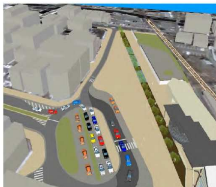
「マイカー送迎ルール（あり・なし）による計画説明」