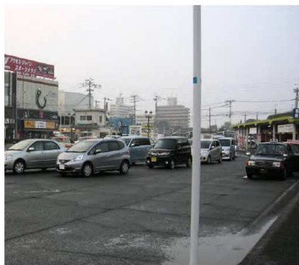
「整備前のマイカー送迎の状況」