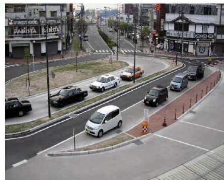
「整備後のマイカー送迎の様子」