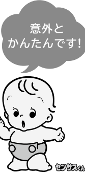
9月に配付している調査書類