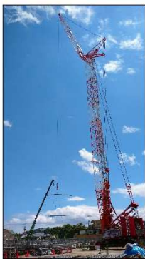
↑ 材料を運ぶ二百 トンのクレーン車