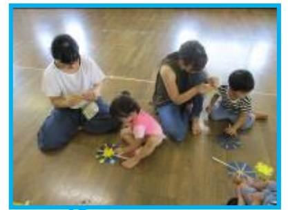
成長を感じられる作品作り