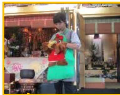
エブロンシアター