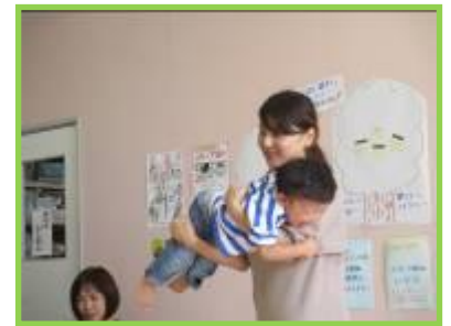
親子でふれあい遊び