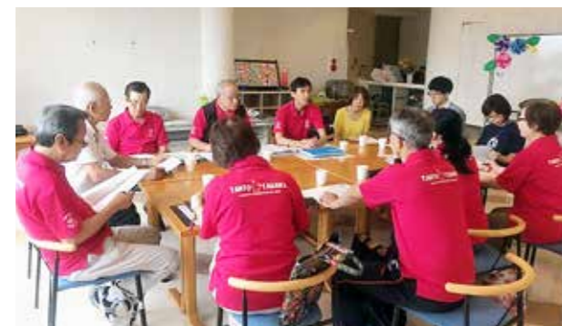
▲定例会では活動を広めるために意見を交わしています