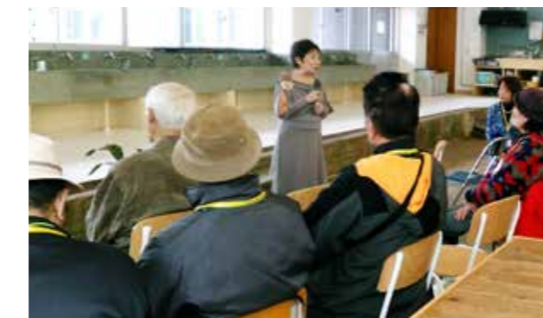
▲毎月の集まりが楽しみになっています