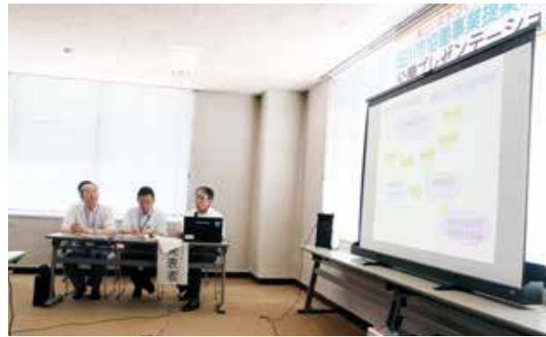
▲公開プレゼンテーションの様子