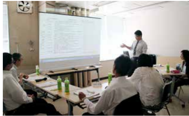
▲審査会では審査員が熱心に意見を交わしました