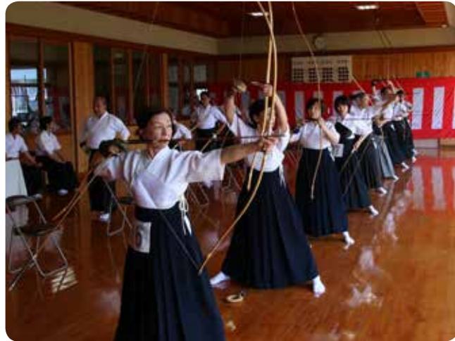
▲的を絞って一点に集中。全身に力がみなぎります