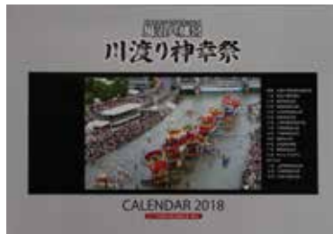
▲今年のカレンダーの表紙

川渡り神幸祭の写真をふんだんに使ったカレンダーを発売します。 ※遠方への発送に便利な用紙を同封しています。 ▼発売開始 9月11日(月) ▼発売場所 風治八幡宮、市役所売店、ミュージアムショップ(田川市美術館内)、シルバークラフトもてなし(石炭・歴史博物館前)、田川商工会議所(大黒町)、重藤写真館(魚町)、ブックワーム川宮店 ▼価格 1千円 ▼問い合わせ まつりIN田川実行委員会カレンダー担当 原田(田川信用金庫添田支店 ☎82・4141)