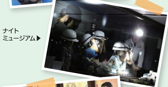
ナイトミュージアム