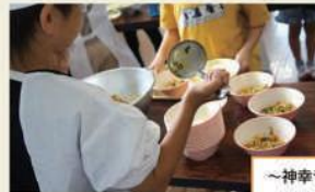
～神幸ライスの具を配膳する様子～

神幸ライスは「川渡り神幸祭」の「山笠のぼれん」をイメージした献立で、緑や白、赤の飾りを野菜で表現しています。そのため、ひき肉をベースに、ナスや玉ねぎ、パプリカ、ネギなどの彩り鮮やかな野菜が主役です。味付けは子どもたちの大好きなカレー風味で仕上げています。