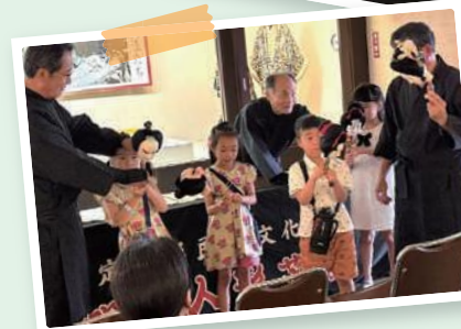
伊加利人形浄瑠璃体験