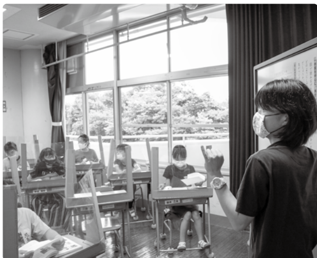
▲学校再開後の授業の様子

このように、教育委員会と学校は連携して、ステイホームを強いられた子どもたちの状況把握および学習支援に取り組んできました。また、子どもたちの状況をつかむためのアンケートを実施しました。