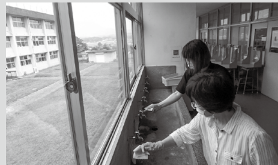
▲抗菌ガラスコーティングの様子