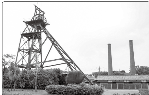
▲旧三井田川鉱業所伊田堅坑櫓と第一・二煙突を含む三井田川鉱業所伊田坑跡は、「筑豊炭田遺跡群」として平成30年10月に国指定史跡となっています。