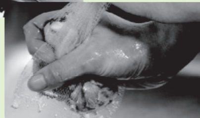
最後にギュッとひと絞り