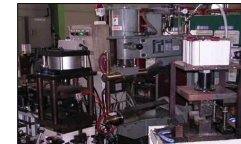
自動メッシュスポット機