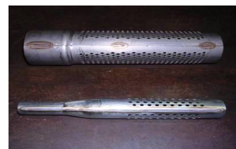
拡管、縮管パンチングパイプ