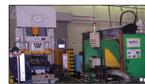
U・Oベンド→Tig溶接ライン