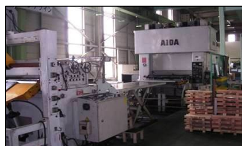
300tパンチングライン(1300幅対応)