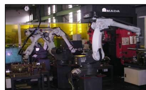
U・Oベンド→Tig溶接→検査→パレタイ無人ライン