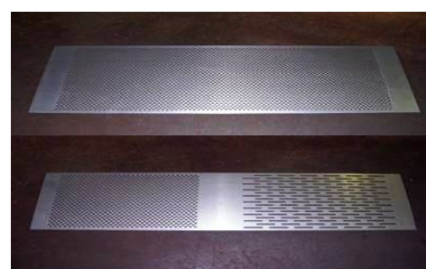
パンチングシート