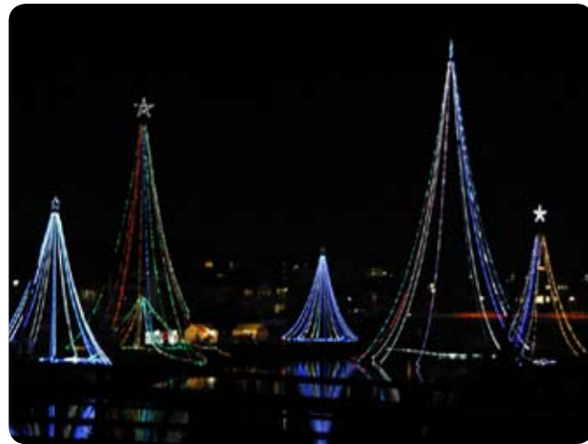
▲水面に浮かぶイルミネーションツリー