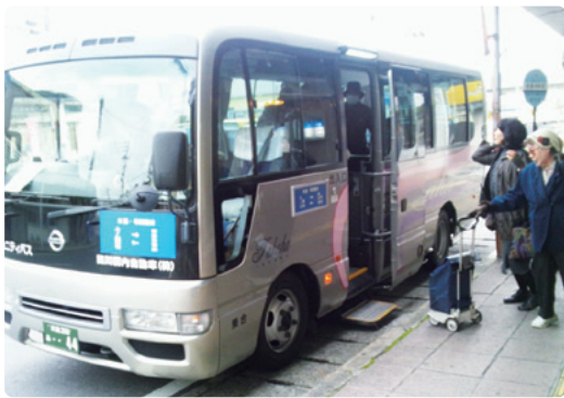
▲たくさんのご利用お待ちしております。

伊田商店街振興組合および後藤寺商店街振興組合では、各商店街で買い物をした人で、コミュニティバスを利用する人に、1回乗車分の無料バス券を配布しています。無料バス券を希望する人は、商店街のお店で買い物をしたレシートを持参して、各商店街振興組合事務所で受け取ってください。 ※後藤寺商店街では、サイクルショップいしはら、今村茶舗、本のこんどう、Gパンセンターでも配布しています。