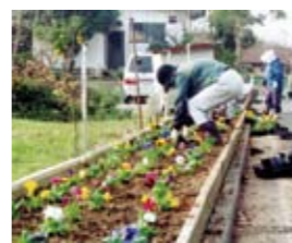
▲泉ヶ丘老人会の花壇整備