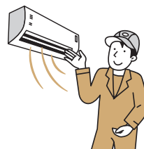
給湯器やエアコンといった設備を省エネ用の高性能なものに交換

省エネ設備の交換や建物自体の冷暖房効果を高めることで、必要なエネルギー消費を抑えることが可能です。断熱性能が高く、暖かい『省エネ住宅』は、住まい手の健康づくりにもつながります。