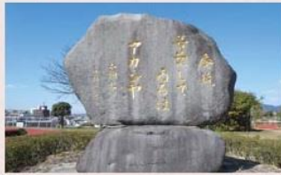
1996(平成8)年建立。俳人種田山頭火の句が刻まれた碑。