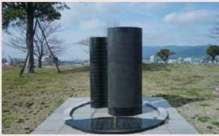
「じん肺」が炭坑労働者の職業病として裁判により認められたことを記念して、2007(平成19)年に建てられた碑。