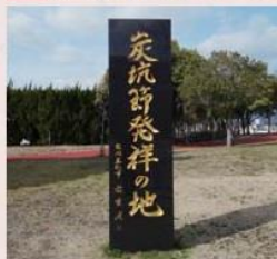
2004(平成16)年建立。 「炭坑節発祥の地」が刻まれた碑。