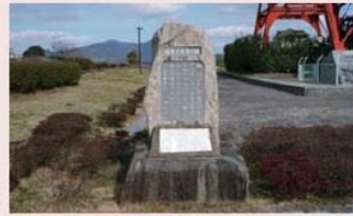
2003(平成15)年建立。三井田川炭鉱に勤務した後、炭坑作家として活躍されました。主な作品は「若き坑夫の像」「筑豊炭田」「富士山頂」など。