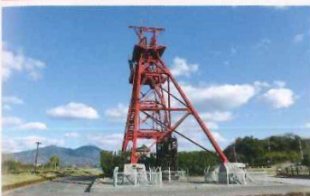
堅坑櫓は、人や石炭等を運ぶためのケージ(カゴ)を昇降させるためのものです。堅坑櫓は2基ありましたが、1909(明治42)年完成の第一堅坑櫓のみ現存しています。夜はライトアップされます。