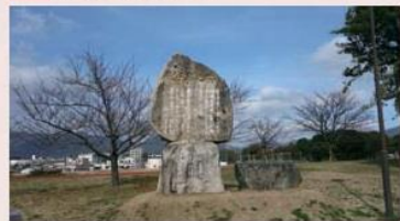
1967(昭和42)年建立。 「月が出た出た月が～」の炭坑節の歌詞が刻まれた碑。