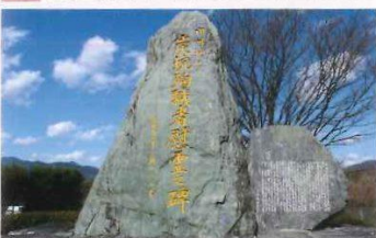
推定2万人とも言われている炭坑殉職者のご冥福を祈り、感謝を捧げるため、1989(平成元年)年10月、募金により建立されました。