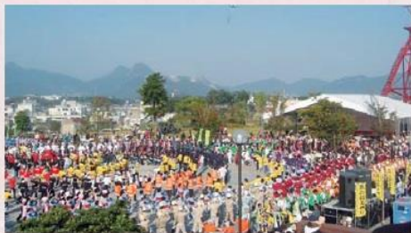
炭坑のまちとして栄えた田川の文化と歴史を全国に発信すること、ふるさと田川の誇りを後世に継承していくことを目的として2006(平成18)年から開催しているお祭りです。毎年11月の第1日曜日とその前日に開催しています。