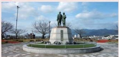
1982年(昭和57)年建立。彫刻家の山名常人民の作品。昭和10年代の姿がモデルで、仕事を終えて帰途につくヤマの夫婦をイメージしています。像が建っている場所はかつての三井田川鉱業所伊田坑(第三坑)の沈殿池があった場所です。