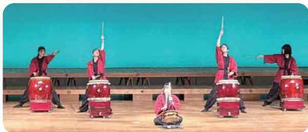
▲福岡県立大サークル「カツドン」

令和7年11月3日(月)に「第41回こども音楽祭」を開催しました。出演者は日頃の練習の成果を十分に発揮し、会場に素敵な音色や歌声を響かせました。さらに今回は和太鼓演奏も加わり、会場には力強く躍動感あふれる音が響き渡りました。最後は出演者が集って「Believe」の合奏・合唱を行い、会場がきれいな歌声やあたたかい手拍子につつまれました。今年も11月に開催予定ですので、みんなで音楽を楽しみませんか。たくさんの参加・來場をお待ちしています。