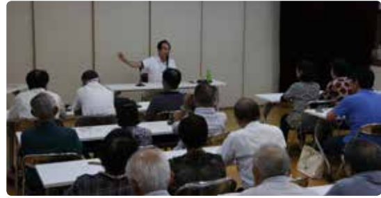
7月24日に 上伊田西公民館で実施