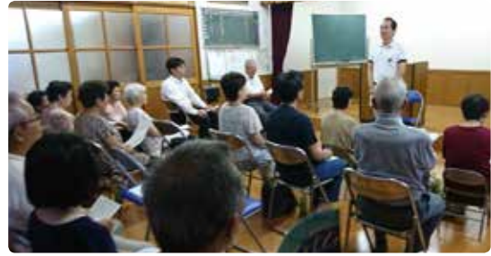
7月27日に 会社町公民館で実施